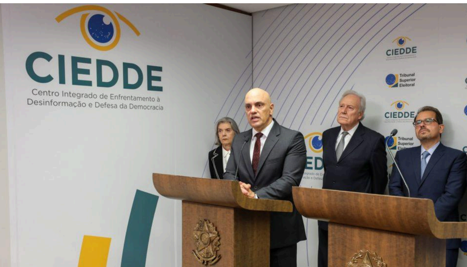
Alexandre de Moraes, presidente do TSE, discursa na inauguração do Ciedde.